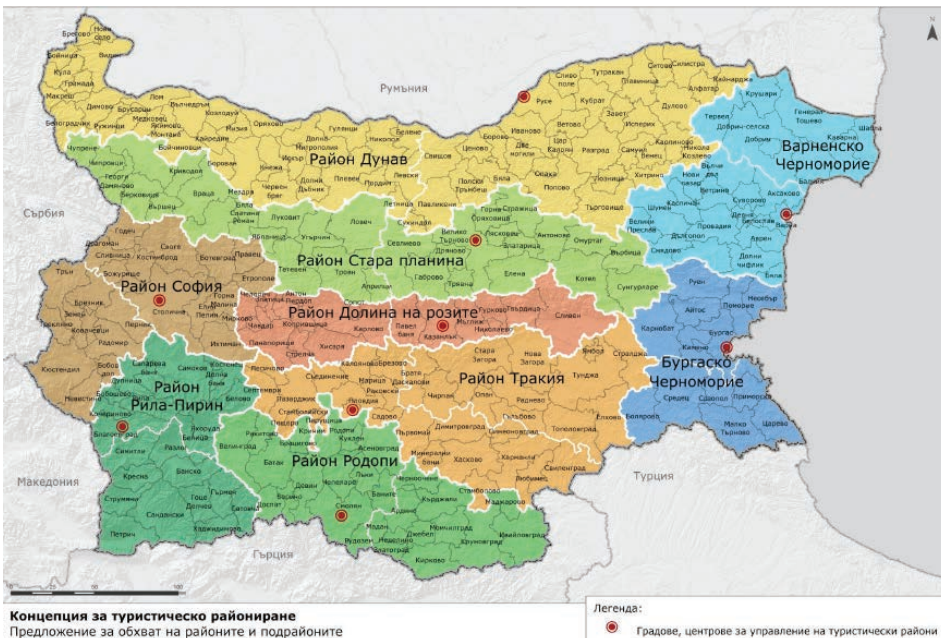
Концепция за туристическо райониране Предложение за обхват на районите и подрайоните

да Концепцията за туристическо райониране на България, разработена съгласно Закона за туризма и приета на Оперативно заседание на Министерския съвет, проведено