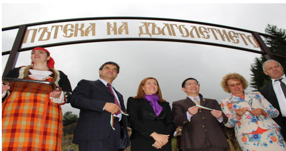
По време на фестивала бе открита и пътека на дълголетие

Събитието бе организирано от „Дем Травел“ ЕООД, Българския център за развитие, инвестиции и туризъм в Китай, китайската компания Bright Dairy, заедно с подкрепата на Министерството на туризма, община Смолян, село Момчиловци, Swagbag.eu и „Тодоров“ АД.