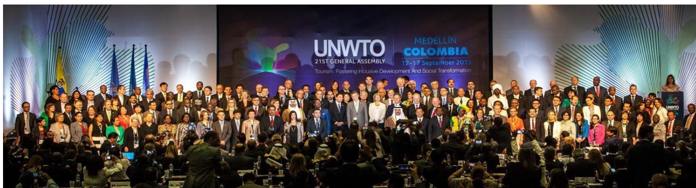
21-вата Генерална асамблея на СOT

На 13 септември, първия ден от заседанието на 21-вата Генералната асамблея на Световната организация по туризъм (СOT), България и Испания бяха избрани за вицепрезиденти на форума, който се провежда на всеки две години. Генералната асамблея на СOT е най-мащабното и престижно събитие за туристическия сектор, на което се обсъждат актуалните проблеми в туризма, определят се целите и визията в политиката на организацията и се избират новите членове на Изпълнителния съвет на СOT и на нейните комисии. Изборът за вицепрезидент е бил направен на 59-та среща на Регионалната комисия за Европа на СOT от 156 държави.