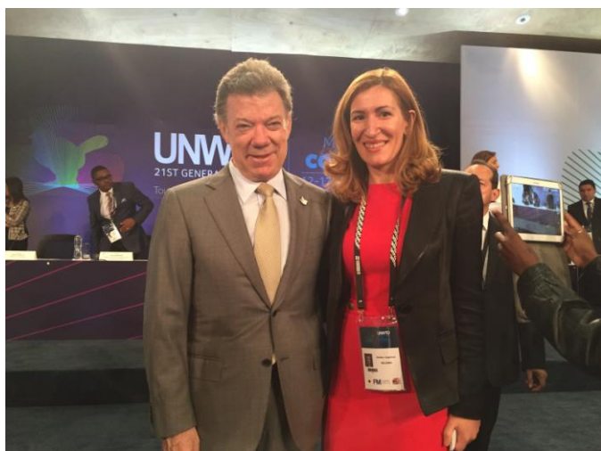
Министър Ангелкова и президента на Колумбия Хуан-Мануел Сантос

Китайските туристи, посетили България през 2014 г., са близо 14 хил., което е с над 30% повече от предходната. За 7-месечието на 2015 г. в страната ни са почивали близо 9 хил. китайски туристи, което е увеличение с над 14%.