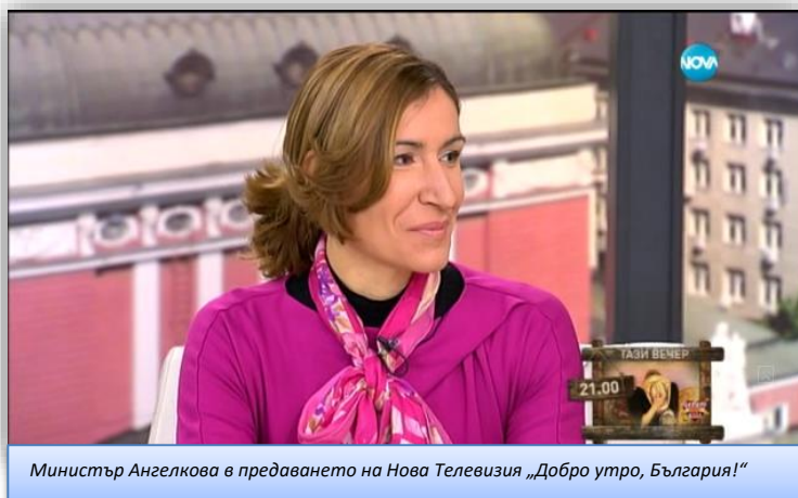
Министър Ангелкова в предаването на Нова Телевизия „Добро утро, България!“

Според прогнозите на Министерството на туризма за зимен сезон 2015/2016 може да се очаква ръст от близки и съседни пазари като Гърция, Турция, Македония и Сърбия. България ще бъде привлекателна и за туристите от Великобритания, за които тя традиционно е изгодна ски дестинация. Очаква се увеличение и на туристи от Израел, Молдова, Нидерландия, Финландия, Норвегия и Швейцария. Вътрешният пазар също се очаква да отбележи ръст, продължавайки тенденцията от изминалия зимен сезон, когато и трите големи зимни курорта регистрираха увеличение на нощувките от български граждани.