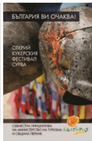
Част от рекламните визии в кампанията